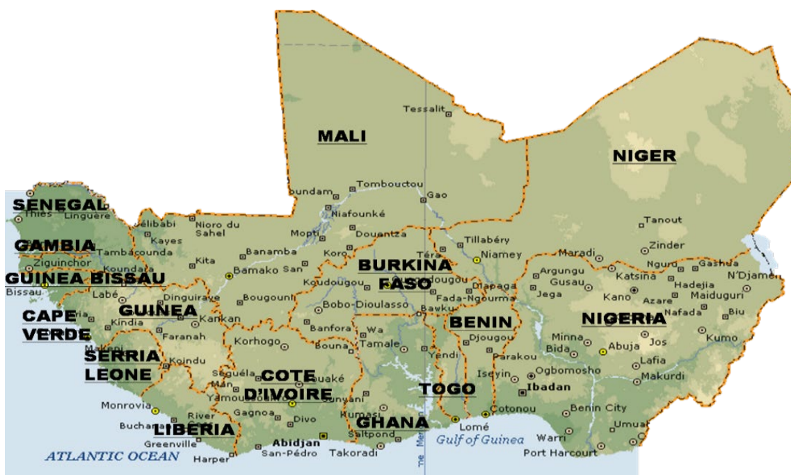
Fig.1. Ubicación y composición de la Región de la CEDEAO