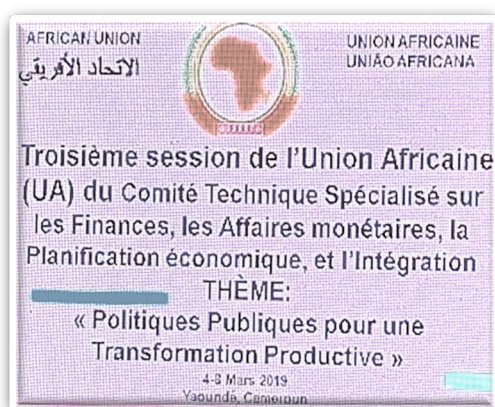
Foto 1. Políticas Públicas para una transformación productiva – Younde, Cameroun, 2019