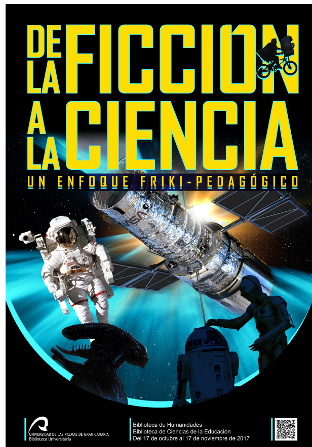
Figura 2. Cartel de la exposición de 2017