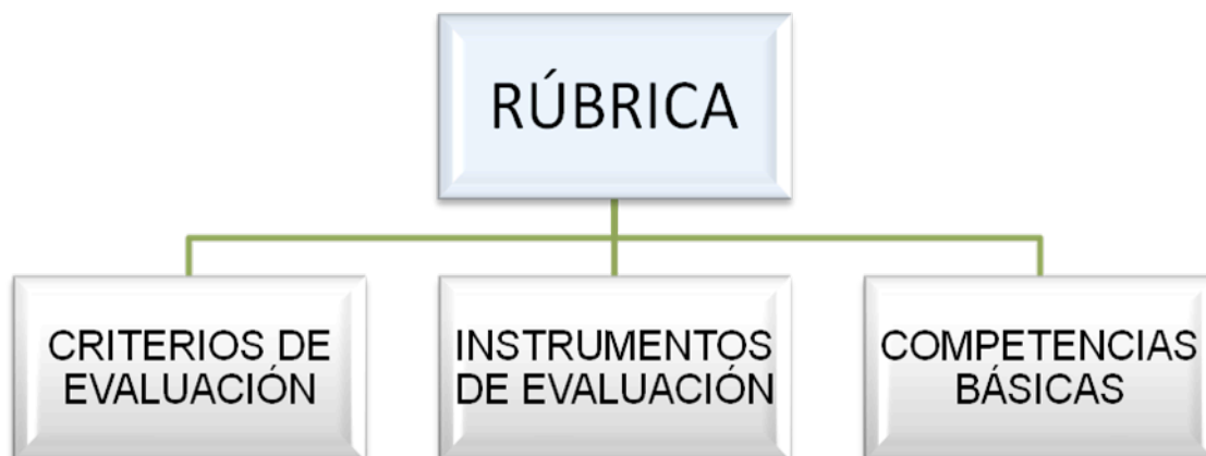
Imagen 1: Evaluación de tareas mediante rúbricas

Anteriormente aludimos a la educación formal como aquella que se imparte en el sistema educativo reglado, y se caracteriza por tener unos objetivos definidos y unas normas y reglas previamente determinadas. La educación no formal es impartida fuera del marco del sistema formal, esto es, fuera del sistema educativo reglado; pero es una actividad caracterizada por unos objetivos explícitos y una planificación y organización diseñadas en función de estos últimos. Sin embargo, denominamos educación informal a aquella que se caracteriza por su escasa o nula organización, por no ser sistemática, por su no intencionalidad y por su extensión a lo largo de la vida, dado que todas las circunstancias del entorno personal y social de un ser humano pueden contribuir a su educación informal (Torrego, 1999: 53). Torrego (ibidem: 80) mantiene, en relación con el fenómeno musical, el siguiente posicionamiento: “Las canciones también se escuchan en muchas ocasiones como mera forma de entretenimiento, como disfrute estético o como procedimiento de identificación con un determinado grupo generacional o social. Esa audición, sin embargo, afecta a toda nuestra personalidad”.