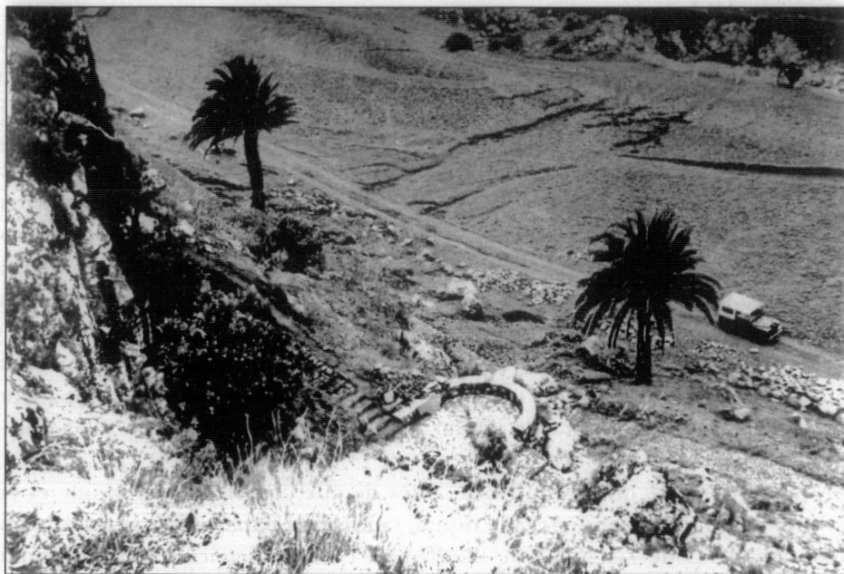
Vista del Jardín Canario en los años cincuenta.