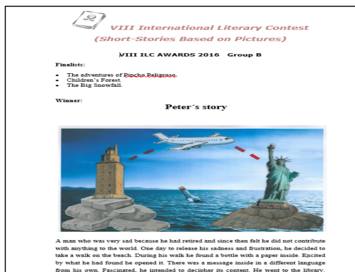
Figura 4. Ejemplo realizado por una alumna.

Por otra parte, en la materia de DLE presentamos el Portafolio Europeo de Lenguas como recurso para que el alumnado tome consciencia de su propio proceso de enseñanza y aprendizaje. Animamos a que todos creen su propio portafolio, con las tres partes que indica el Consejo de Europa: Pasaporte, Biografía y Dossier. Es en este último en el que incorporan, como una muestra más de sus trabajos, tanto si han resultado ganadores como si no, su aportación original. De este modo se sienten incentivados, aunque no ganen porque su esfuerzo se ve también recompensado. Además, les sirve como ejemplo para que después ellos mismos puedan llevar a cabo este tipo de actividades con sus futuros alumnos en las escuelas de Educación Primaria.