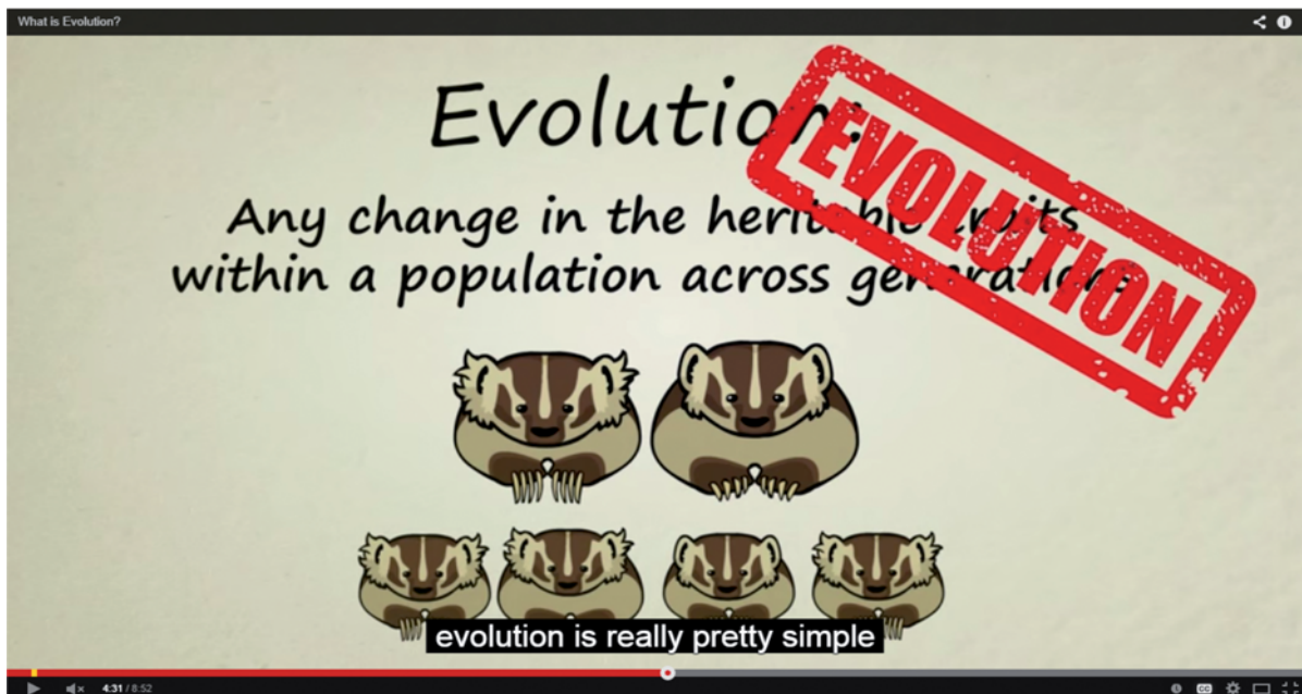
Figura 2. Ejemplo de un vídeo utilizado en clase

Los vídeos que se escogen para las clases suelen ser animaciones donde aparecen dibujos sencillos y palabras sobreimpresas. Como recomienda Blasco Mayor (2009), a la hora de seleccionar los vídeos, se ha tenido en cuenta como factor importante la dicción: se intenta que sean vídeos donde el narrador no hable muy rápido y no tenga un acento demasiado marcado. El alumno conoce previamente el tema de vídeo, ya que éste coincide con el tema de la clase o de la unidad didáctica. En la Figura 2 encontramos un ejemplo de un vídeo sobre la evolución, utilizado en clase de Biología en el noveno grado: como se puede ver en la imagen, se trata de animaciones acompañadas de subtítulos.